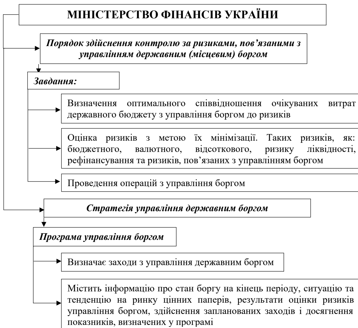
Рис. 4. Схема внутрішнього аудиту ефективності управління державним боргом

Повна схема організації та здійснення внутрішнього аудиту ефективності управління державним боргом Міністерством фінансів України зображена на рис. 4.