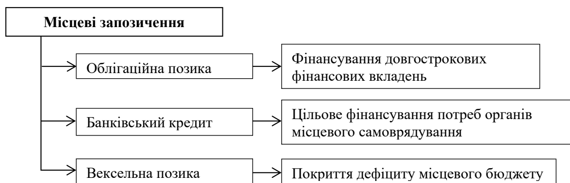
Рис. 1. Види місцевих запозичень та напрями їх використання

дефіциту бюджету поточного року і не використовується для інвестиційних цілей.