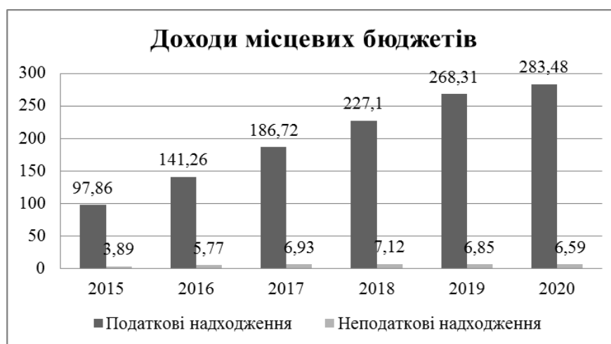
Рис. 2. Структура доходів місцевих бюджетів у 2015–2020 рр., млн грн

Результати аналізу структури місцевих бюджетів України за останні п'ять років засвідчують тенденцію до зростання доходів місцевих бюджетів від податкових надходжень, натомість неподаткові надходження останні три роки зменшувалися. Потрібно зазначити, що у структурі доходів місцевих бюджетів неподаткові доходи не відіграють значної ролі (рис. 2). Проте саме неподаткові надходження включають запозичення, які використовуються як додаткове джерело фінансового забезпечення і які за певних умов можуть забезпечити економічний розвиток територіальної громади. Загалом позикові кошти в бюджетному процесі розглядаються як витрати розвитку, від яких у майбутньому очікується отримання певного економічного або соціального ефекту.