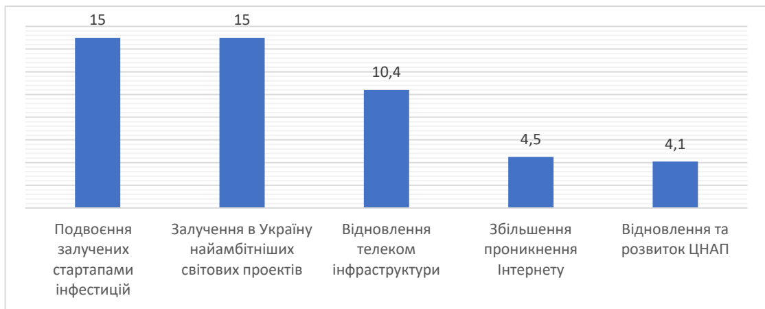
Рис. 2. Найдорожчі проєкти цифрової відбудови України на 2022–2025 рр., млрд дол. США

На інших напрямки припадає 1,3 млрд грн – 2 % від загального бюджету на діджиталізацію. Серед іншого їх хочуть витратити на запровадження штучного інтелекту для надання публічних послуг чи створення електронного архіву.