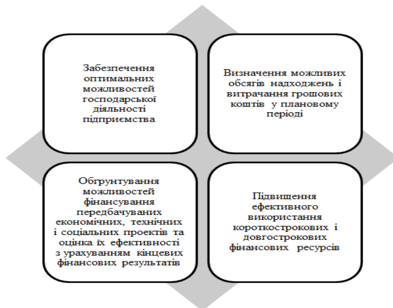
Рис. 3. Критерії мети поточного планування

Мета поточного фінансового планування формується на основі вибраних критеріїв, що реалізують фінансові рішення, які, в свою чергу, спрямовані на підвищення ефективності роботи підприємства, а саме це стосується максимізації продажів, збільшення прибутку, що належить до власності підприємства. Проводячи аналіз, по більшій мірі науковому діапазоні літератур, можна розкрити сутність мети планування та представити як це зображено на рис. 3.