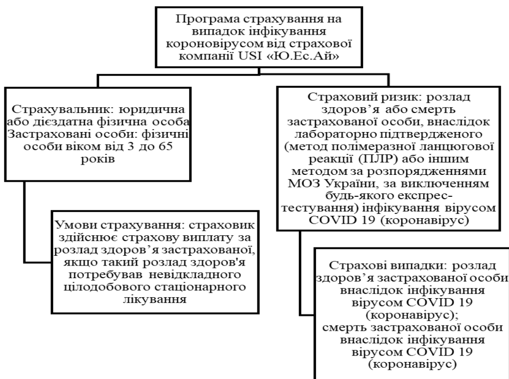
Рис. 2 Програма страхування на випадок інфікування коронавірусом від страхової компанії USI «Ю.Ес.Ай»