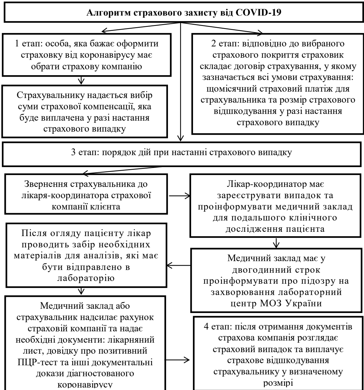
Рис. 3 Алгоритм надання страхового захисту від COVID-19

– отримання необхідної своєчасної медичної допомоги страхувальнику тощо.