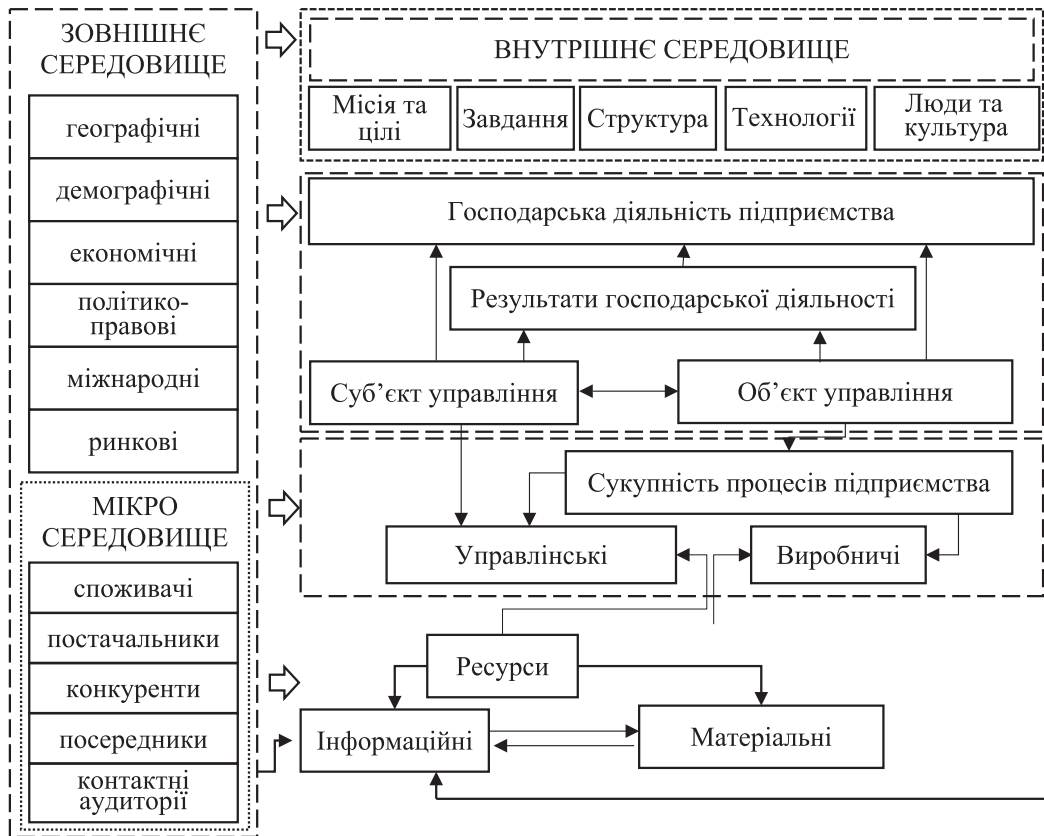
Рис. 2. Загальна логіка впливу зовнішнього середовища на діяльність підприємств