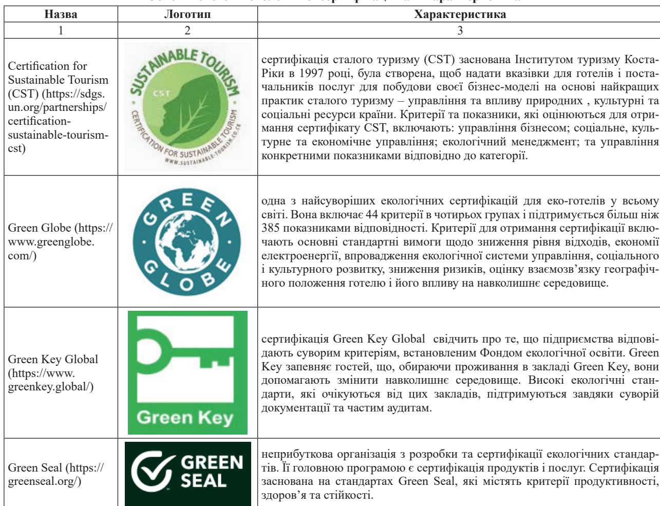
Основні системи екологічної сертифікації та їх характеристика