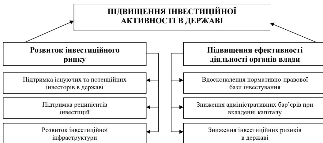
Рис. 3. Дерево цілей концепції управління інвестиційним кліматом в національній економіці