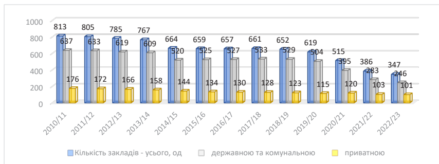
Рис. 1. Динаміка кількості закладів вищої освіти в Україні за 2010/11–2022/23 рр., одиниць

Варто зазначити, що війна суттєво вплинула на формування освітнього та людського капіталів, що суттєво ускладнює економічні процеси зараз, так і під час очікуваного повоєнного відновлення. З початку повномасштабного вторгнення Росії в Україну в 2022 році освітній процес зазнав суттєвих змін: навчання часто відбувається в онлайн форматі; майже в усіх закладах освіти було організовано бомбосховища; вступна кампанія змінила формат від зовнішнього незалежного оцінювання до національного мультипредметного тесту. Наслідками війни стала масова еміграція молоді, яка в умовах затяжного характеру війни скоріше за все буде реалізовувати свій потенціал в інших країнах.