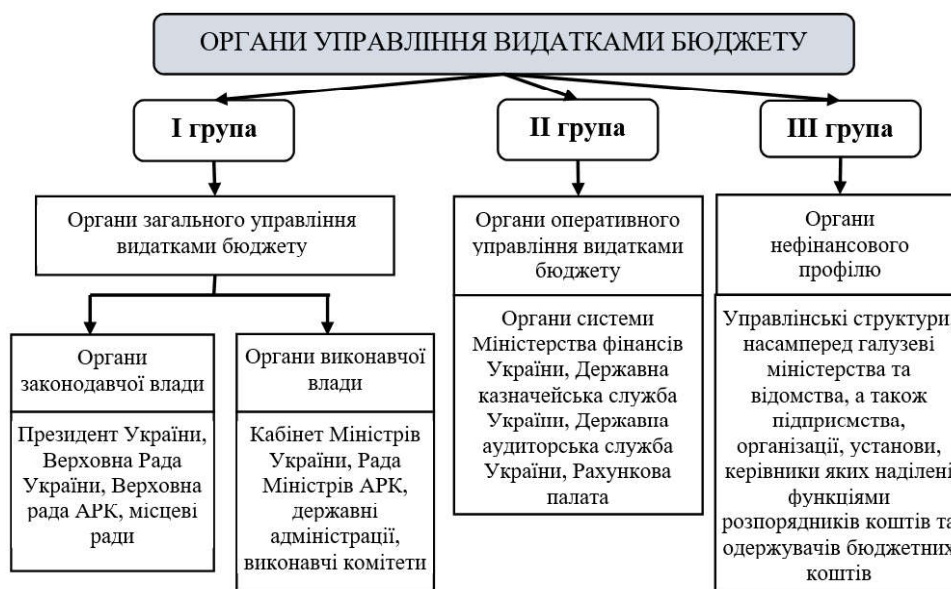
Рис. 2. Суб'єкти системи управління видатками державного бюджету