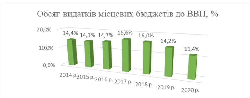
Рис. 2.2. Обсяг видатків місцевих бюджетів до ВВП у 2014–2018 рр.

частину фінансових ресурсів, яка розподілена між суб'єктами місцевого самоврядування. Нормативне значення цього показника має такі критерії: якщо цей показник становить 15 %, то рівень децентралізації є високим, 15–10 % – середнім, нижче 10 % – низький.